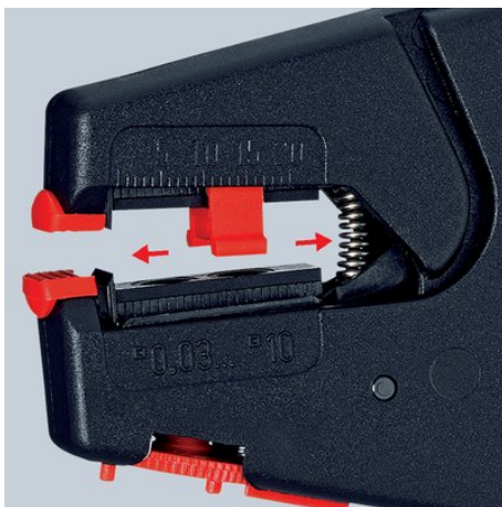
12 40 200: opritor reglabil pe lungime

Ne rezervăm dreptul asupra modificărilor tehnice #i posibilelor erori.